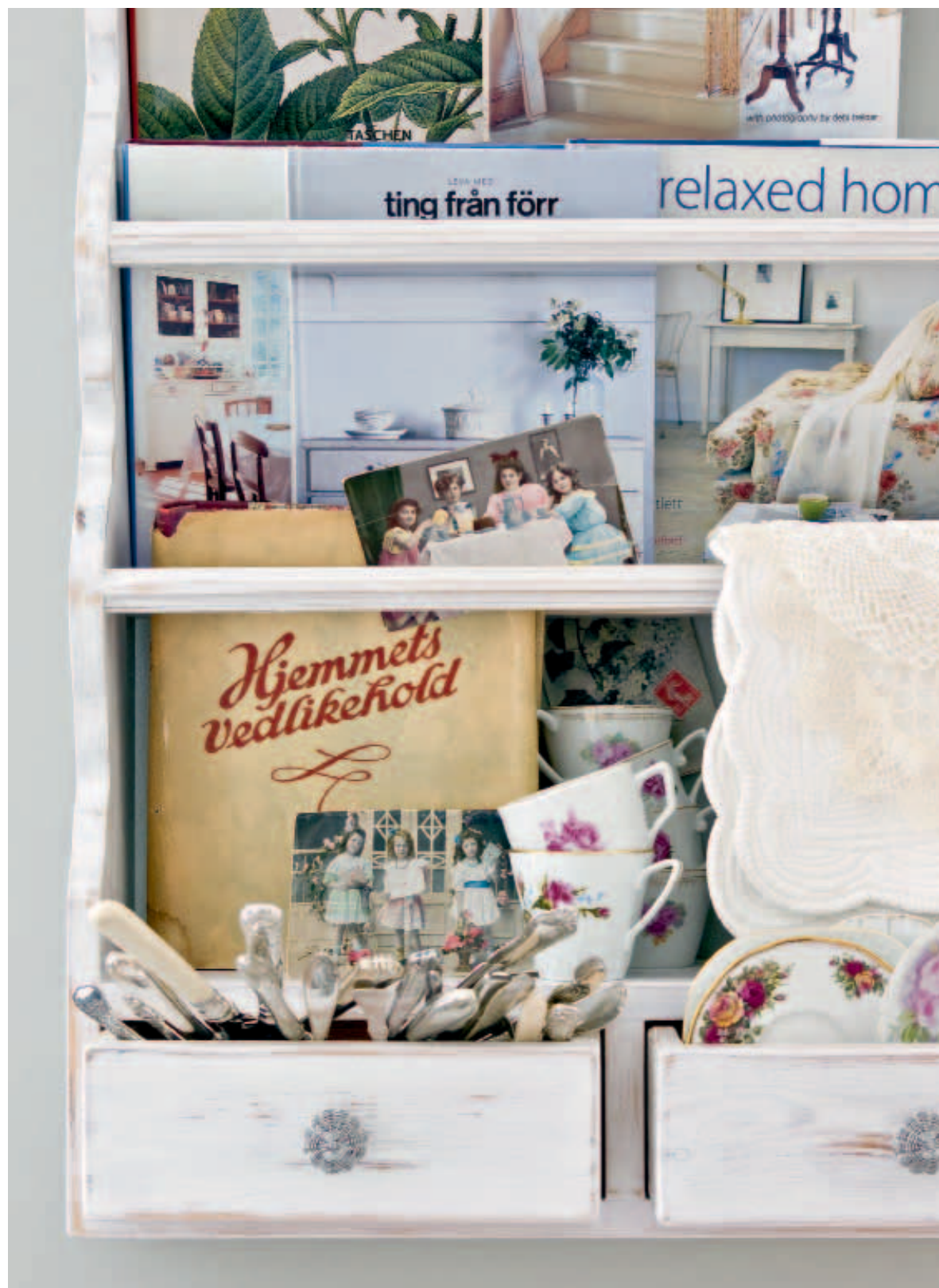
In dit oude bordenrek heb je genoeg plaats voor je kookboeken, kopjes en bestek.