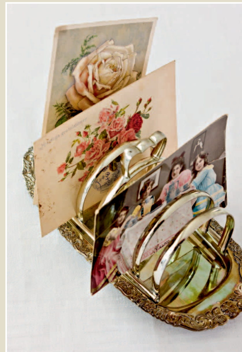
Veel te mooi voor geroosterd brood! Oude ansichtkaarten of nieuwe brieven vallen in een zilveren toasthoudertje nog beter op.